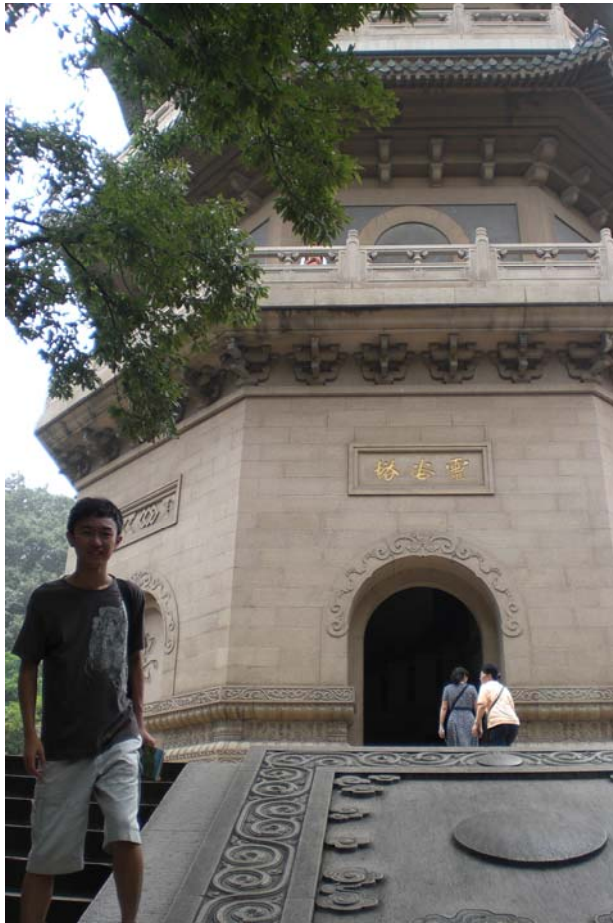
民政府將無梁殿改為國民革命將士紀念堂。

我們參觀中山陵後便順道到靈谷寺參觀，靈谷寺是南京著名寺廟之一。1983年被國務院列為漢地佛教全國重點寺院。靈谷寺原名開善寺，是南朝梁武帝所興建，原地址在鍾山南麓獨龍阜。唐末乾符年間改名為寶公院。明朝建都南京後，明太祖遷寺于鍾山東南麓，賜額"靈穀禪寺"。幾經滄桑，如今的靈穀寺主要有山門、天王殿、大雄寶殿、無量殿、寶公塔等建築。靈穀寺的主建築為無梁殿，高22米，寬近54米，深近38米。整個建築都用磚造，不施寸木。殿中供三大佛，兩旁塑二十四天。1928年國