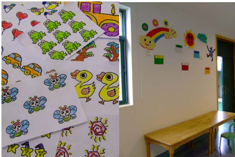
左圖是我們做的教材，右圖是氣象站。

的方法是諮詢意見，更好的是諮詢反對者的意見，只有明瞭反對者的意見才可考慮得更完美，更周全。