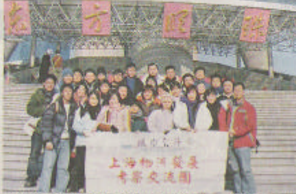
◆交流團在著名的東方明珠塔前合照。