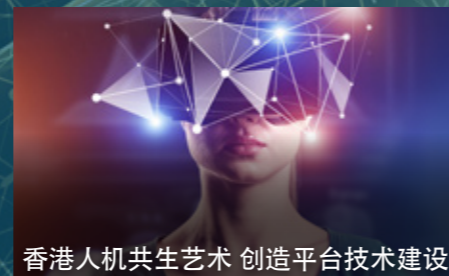
香港人机共生艺术 创造平台技术建设