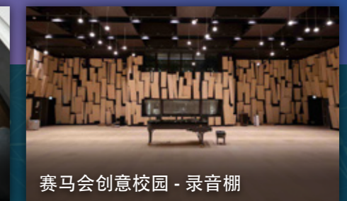
赛马会创意校园 - 录音棚