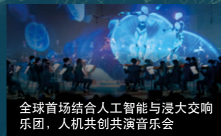
全球首场结合人工智能与浸大交响乐团，人机共创共演音乐会