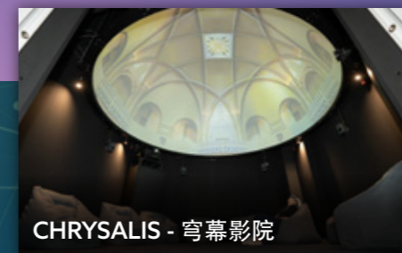
CHRYsalis - 穹幕影院