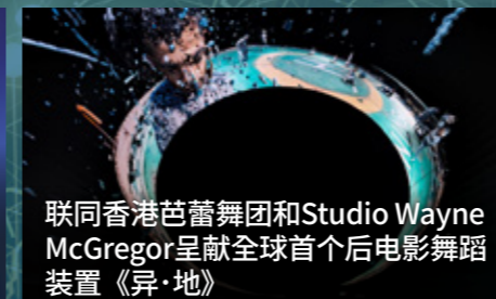
联同香港芭蕾舞团和Studio Wayne McGregor呈献全球首个后电影舞蹈装置《异·地》