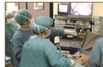
手術後中醫藥調理可助減少不適

手術後用中醫藥調理，可減少或消除術後各種不適，加速康復。如肺癌術後，患者存在咳嗽、胸痛、氣喘、乏力等，屬於肺脾兩虛，中醫補益肺脾，寬胸理氣化痰止痛，可以較好緩解上述不適，促進身體盡快恢復。如胃腸腫瘤術後，出現腹脹、食慾差、腹痛、便秘或腹瀉，可以健脾和胃，理氣化濕之藥舒緩。經過手術後2-4周的中藥調理，患者脾胃消化功能得到恢復，體力增強，手術引起的種種不適已得到大部份的緩解。為術後的進一步化療或放射治療創造條件。對於需要術後放療或化療的患者，中醫藥如何配合？可以參考本書後面章節。