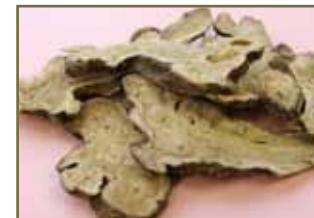
白術補脾益氣、燥濕利水

消化道副反應 — 化療後患者常有食慾減退、噁心、嘔吐、腹痛、腹瀉、便秘等。中醫以健脾和胃、降逆止嘔法治療。常用藥如：白術、茯苓、砂仁、陳皮、竹茹等。推薦食療方：陳皮5克，砂仁5克(去殼)，大棗5枚，山藥15克，大米100克，生薑絲少量，煲粥食用。