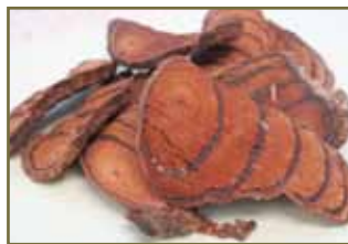
雞血藤補血活血、通絡舒筋

神經毒性 — 某些化學藥物會造成周圍神經損害而出現指（趾）端麻木、跟腱反射減退等。中藥治療原則是祛風活血、通經活絡等。常用藥如路路通、雞血藤、桑枝、牛膝等。推薦外洗方：雞血藤20克，紅花8克，艾葉10克，加水2500毫升，煎藥水1000毫升，以溫水，浸泡手腳20分鐘。每日1次。