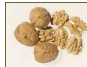
胡桃仁 溫陽固腎、納氣平喘