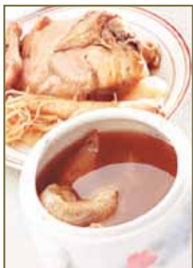
根據不同體質選擇「亦藥亦食」的食材

調胃首重飲食調理，藥食同源，根據不同體質選擇「亦藥亦食」的食材，經過精心炮製出色香味美的藥膳，可以增強病人的食慾。另外，要重視患者大便的調理：要治理好便秘及腹瀉。只有飲食大小便正常，患者才能方便獲得營養能量，為抗腫瘤提供物質基礎，試想如果患者飲食極差，營養嚴重不良，又如何抗癌康復呢？