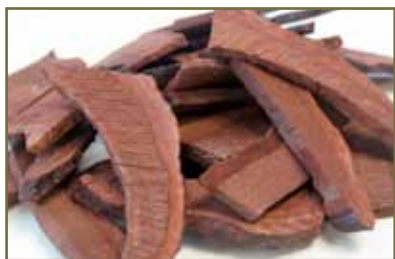
靈芝有助提升人體免疫功能

目前尚無有力證據提示靈芝能預防癌症復發，因此不能單獨以靈芝預防癌症復發，當然靈芝對提升人體免疫功能可能有幫助。由於癌症復發原因極其複雜，每個病人復發的風險程度不同，有的病人容易復發，有的病人復發機會甚微。對於復發高風險人士應該尋求專業醫師診治。