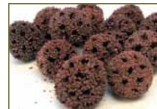
路路通祛風活絡、利水通經

化療脫髮 — 中藥採用補血生髮、補腎養陰、涼血活血治療脫髮。常用藥如熟地、何首烏、女貞子等。