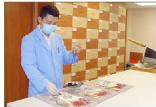
中醫用藥講究辨證、配伍、禁忌

中藥具有自身的特性—四性：寒熱溫涼；五味：辛甘酸苦鹹；有的作用升浮，有的沉降；有的發表宣散，有的收斂固澀。有的作用溫和，有的作用峻烈。這些特性就是中藥的「偏性」，而疾病屬於人體處於「陰陽臟腑經絡氣血」的「偏差」狀態。中醫治療疾病，所謂治病求本，實際上是以中藥的「偏性」糾正疾病的「偏差」。中醫用藥講究辨證、配伍、禁忌等。中藥在臨床中要把握好各個環節的應用特點加以合理使用，才能增加療效，降低不良反應發生的機會。