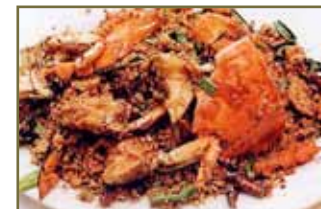
避免食辛辣刺激性食品

實際上忌口大多基於經驗積累，而非嚴格科學對照試驗的結論。在不影響營養均衡的情況下，適當忌口對疾病的康復是有幫助的。需要留意的是，具有不同疾病，不同體質類型，不同治療方法的患者，忌口因之不同。