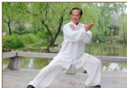
氣功或太極有助鬆弛身心

調胃重點在飲食忌口與食療。抗癌方面則選取根據腫瘤局部特徵（參考現代影像學檢查，如電腦掃描(CT) 或正電子電腦相融掃描(PET-CT)），參考現代中藥藥理研究證明有抗癌作用的中藥加以治療。通過三調及中藥抗腫瘤治療在一定程度上控制殘餘癌細胞，減少復發和轉移機會，提高遠期療效。