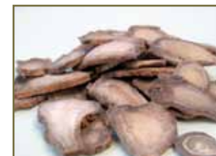
三七止血散瘀消腫止痛