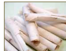
白茯苓 健脾寧心、利水滲濕