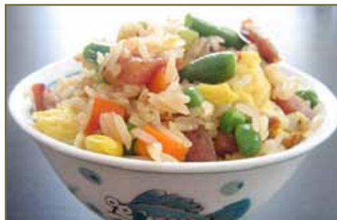
均衡飲食、適量運動是積極的防癌措施

若從中醫角度看，這些植物各有其特性，有的偏寒，有的偏熱。即使選用也需注意產品是否與體質相符，例如紅參較燥熱，燥熱的人吃了人參，則可能會長瘡、上火。綠茶則較寒涼，體質偏寒的人喝了綠茶，或會導致腹瀉。有重要的話建議諮詢中醫師或營養師的意見。